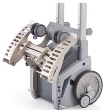
Mécanisme pliant pour un transport peu encombrant