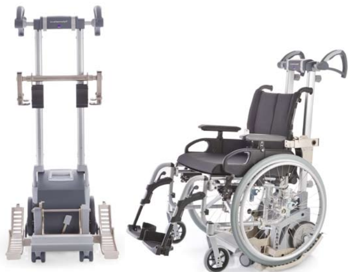
scalamobil S35 IQ avec scalaport X7