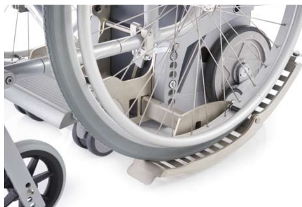
Réglage rapide à la largeur du fauteuil roulant