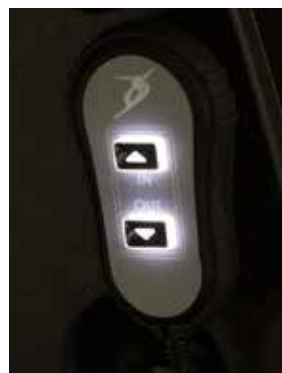
Commande à un bouton avec témoin lumineux.