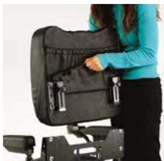
Back-Off permet de retirer facilement l'arrière de l'appareil d'aide à la mobilité réduite pour le faire entrer dans un véhicule à espace restreint.