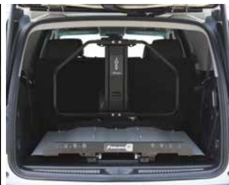
Barrière de sécurité exclusive à l'industrie. Protégé par le brevet américain numéro 403.615