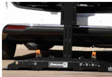
La ceinture de barrière de sécurité* comprend deux sangles d'arrimage rétractables, pour une tranquillité d'esprit totale.