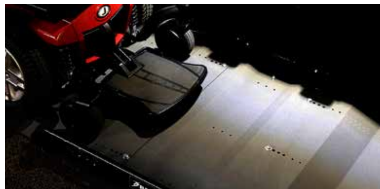
Plateforme illuminée pour chargement de soir.